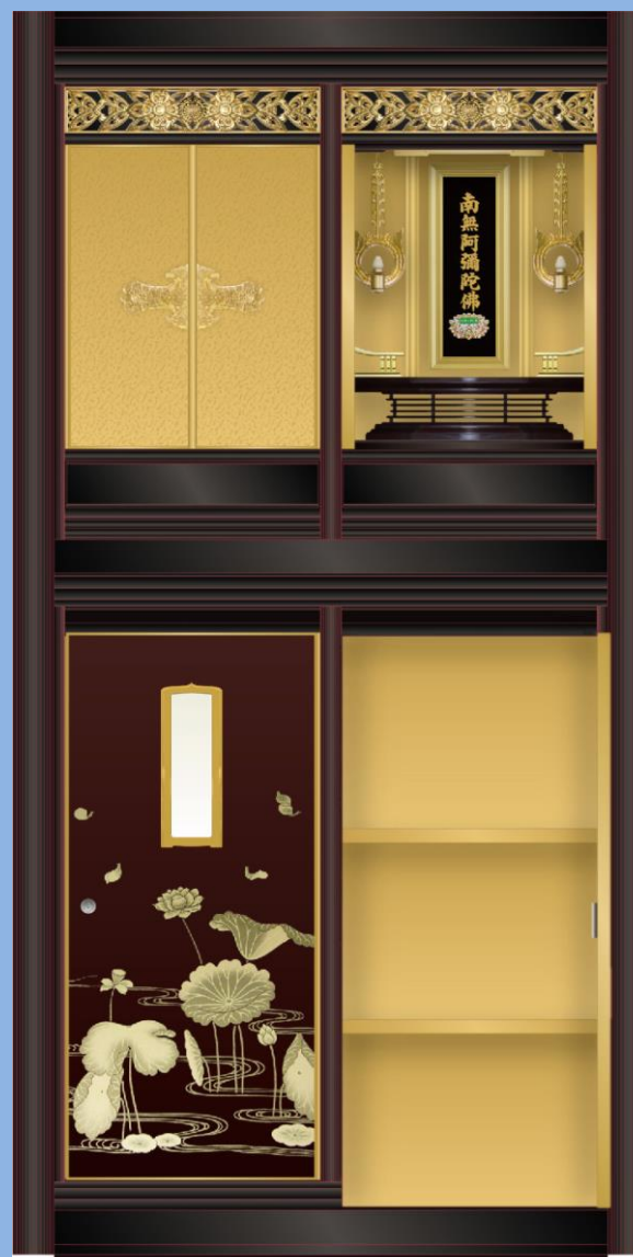
仏壇付き納骨壇(幅 40cm) 特別懇志額 110万円以上