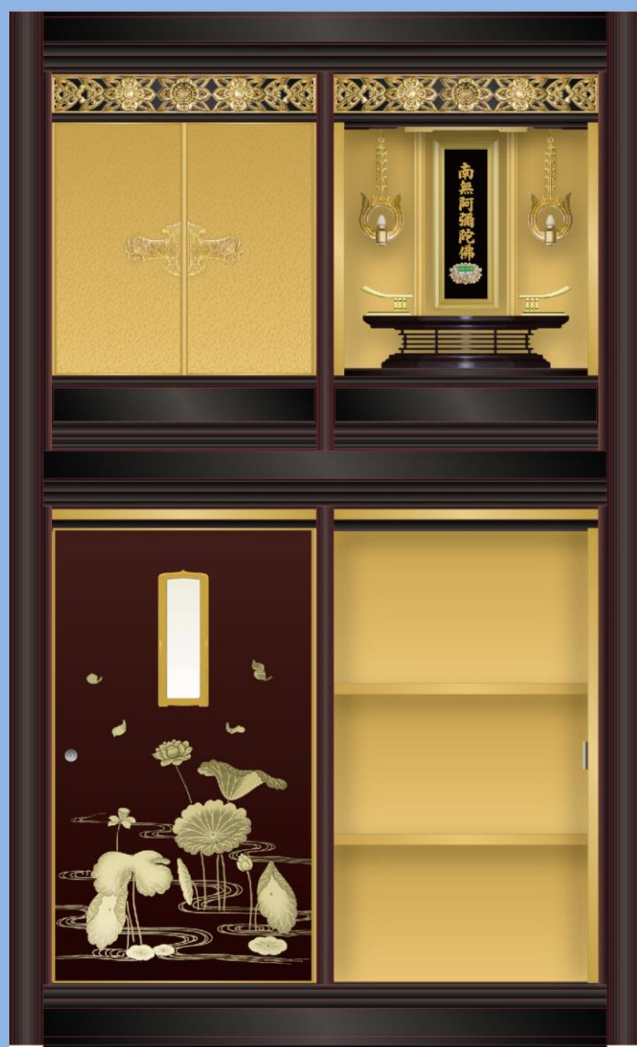
仏壇付き納骨壇(幅 50cm) 特別懇志額 130万円以上